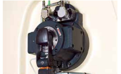
Daha fazla esneklik için çok daha hızlı strok değişimi.