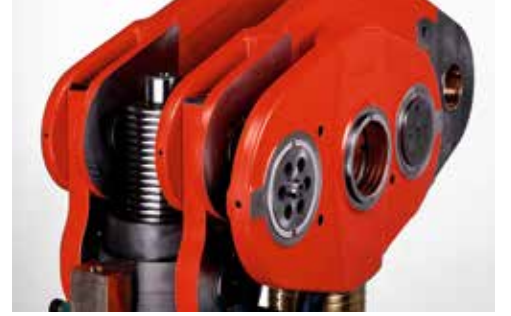
Üretim koşulları altında makina çalışırken yapılabilen koç ayarı.

Strok değişikliği, farklı strok yüksekliklerinin hızlı ve güvenli bir şekilde ayarlanmasını mümkün kılar. Böylelikle yüksek esneklik ve çok yönlü kullanım garanti edilmektedir. Tüm bunların sonucunda ekstra bir işlem yapmadan şerit bandın beslemesinde ki besleme zamanlaması da senkronize edilmiş olur.