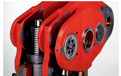
Regulación del carro durante la marcha bajo condiciones de producción.

El cambio de carrera facilita una rápida y segura regulación de diferentes alturas de carreras, garantizando una elevada flexibilidad y versatilidad de empleo. La sincronización con el alimentador de banda se realiza automáticamente sin necesidad de otras intervenciones.