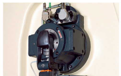
Mayor flexibilidad gracias al cambio de carrera rápido.