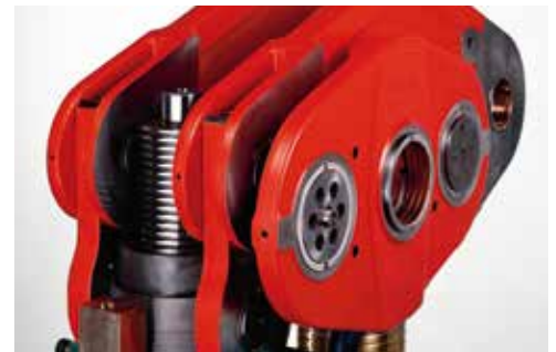
Réglage du coulisseau alors que la presse est embrayée en production.

Grâce au système unique de guidage du coulisseau, les vis trempées et rectifiées n'absorbent chacune que 20% de la charge totale. Cette conception permet de régler la hauteur du coulisseau durant le process de découpe et de maintenir ainsi la position du point mort bas dans un intervalle de tolérance serré tout au long du processus.