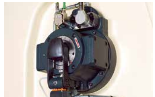
Changement de course rapide, pour plus de flexibilité.

Le changement de course permet de régler rapidement et en toute sécurité les diverses hauteurs de course, ce qui garantit une flexibilité élevée et des applications très variées de la presse. La phase de l'amenage est automatiquement synchronisée sans réglage complémentaire.