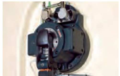
快速更换行程，更大的灵活性。