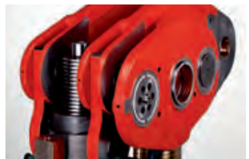
冲压过程中的滑块动态调整。