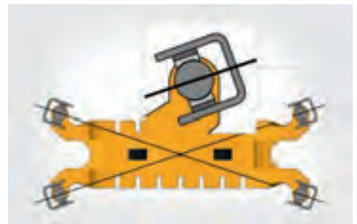
热平衡的滑块导向装置补偿水平方向上的热变形。