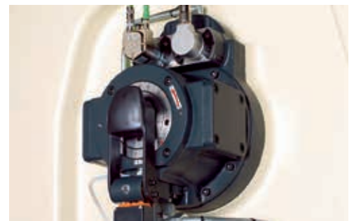
Schneller Hubwechsel für mehr Flexibilität.