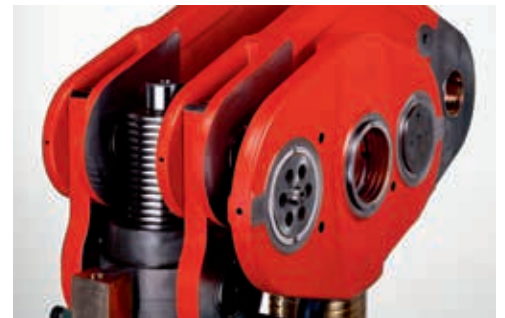
Stösselverstellung während des Laufs unter Produktionsbedingungen.

Der Hubwechsel ermöglicht das schnelle und sichere Einstellen von verschiedenen Hubhöhen. So sind hohe Flexibilität und vielseitiger Einsatz garantiert. Ohne zusätzliche Eingriffe wird dabei die Vorschubphase des Bandvorschubes synchronisiert.