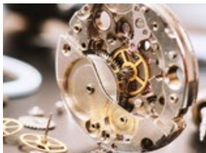
Klein- und Uhrenteile